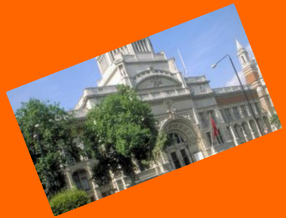
Victoria a Albert Museum