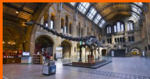
Natural History Museum