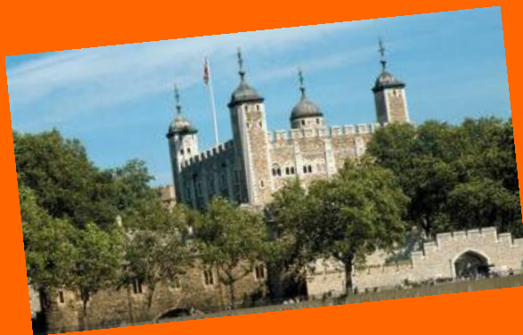
Tower of London Edo Weiss. IX.B