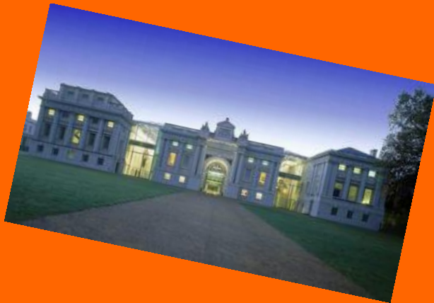
Royal Museum Greenwich