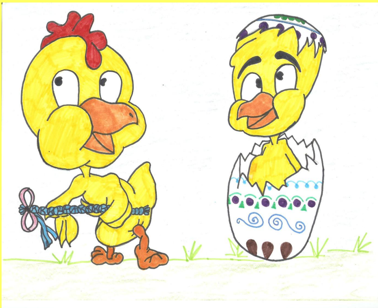
Autorka obrázku: Ráchel Červáková, VII.D