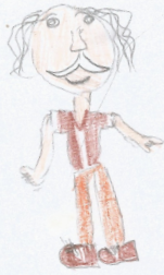
Ella Šimkovič 2.S

Uprostred lesa ochorela náhradka. To sa išiel pozrieť čo sa stalo. Uvidel, že si robili Dedko sa vybral a spolu hľadali kvesol a spolu hľadali Aj chcel pomôcť a sake mu videla kde rastie. A sake ju spolu pozbierali a dedko ich vložit do a odišli.