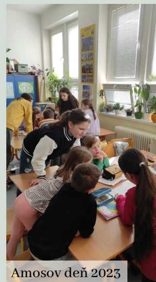
Amosov deň 2023