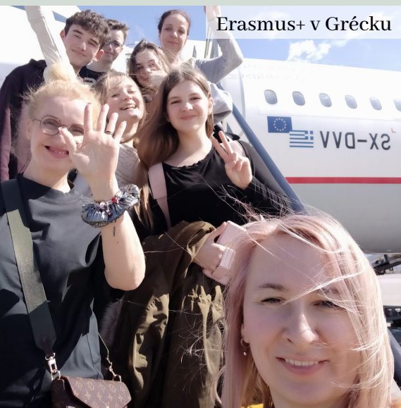
Erasmus+ v Grécku