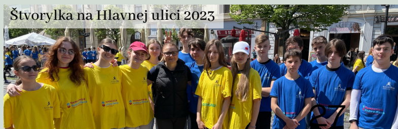
Štvorylka na Hlavnej ulici 2023