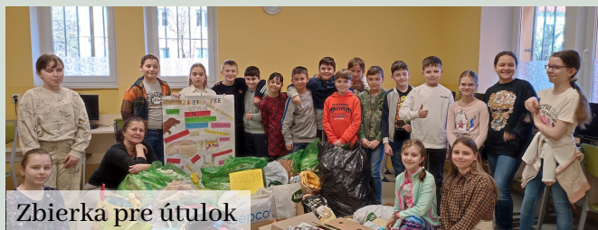
Zbierka pre útulok