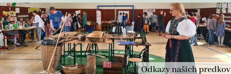
Odkazy našich predkov