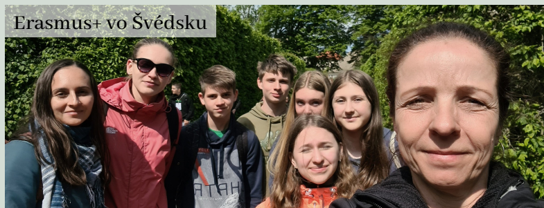
Erasmus+ vo Švédsku