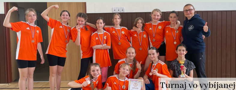
Turnaj vo vybíjaní