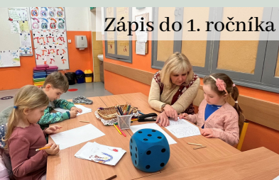
Zápis do 1. ročníka