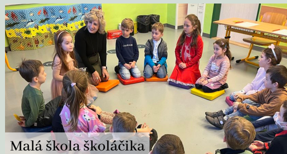
Malá škola školáčika