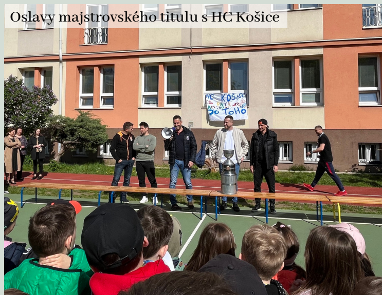
Oslovy majstrovského titulu s HC Košice