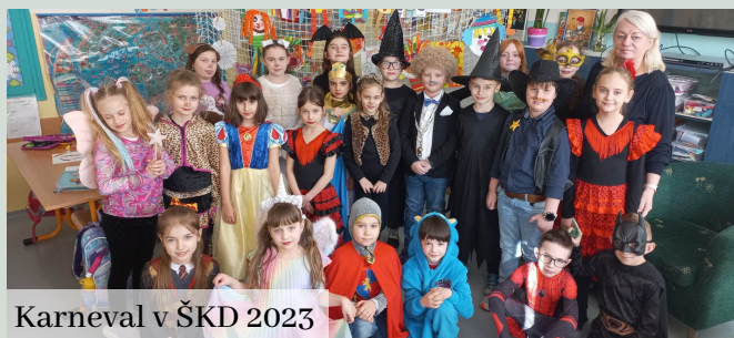
Karneval v ŠKD 2023