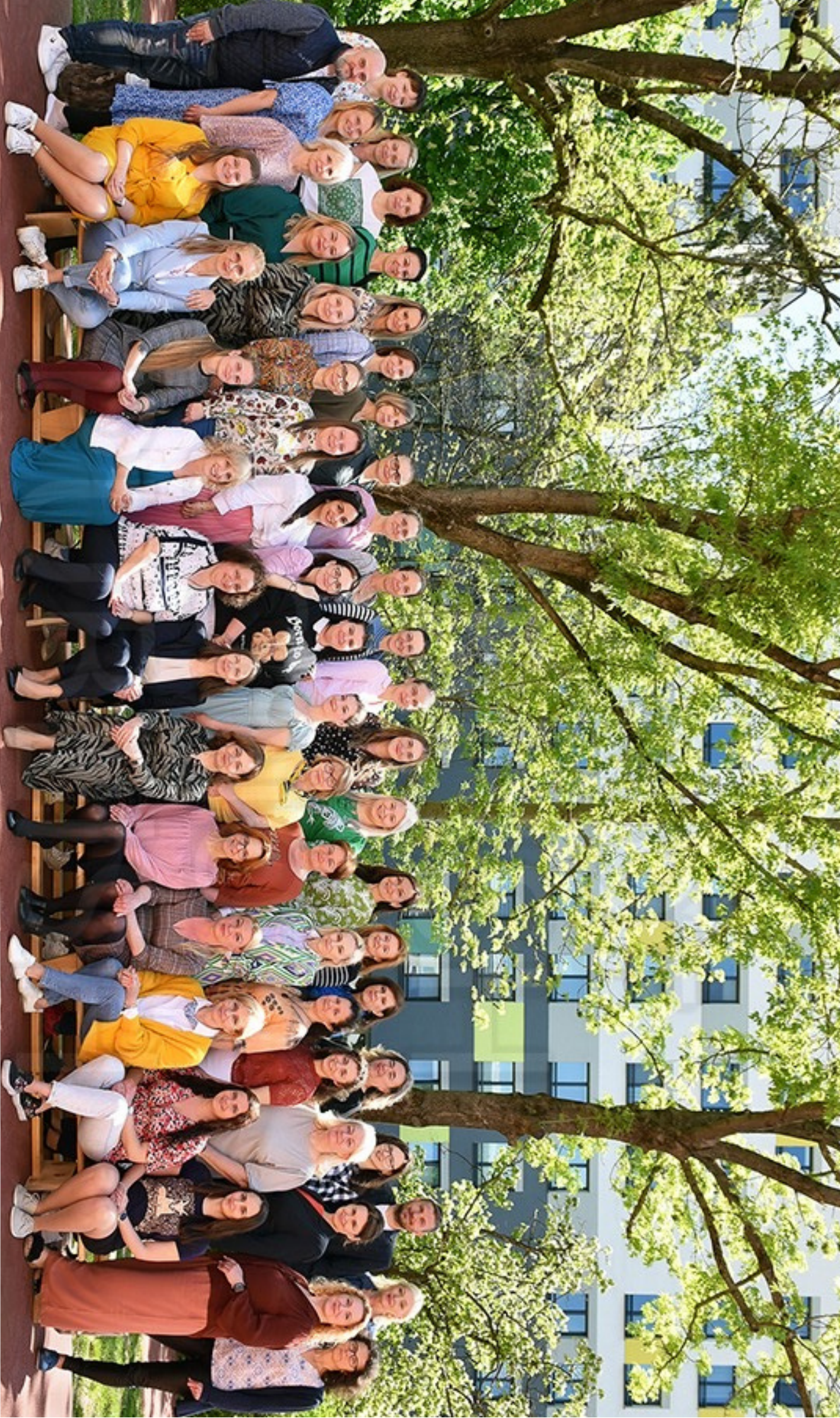
Pedagogický zbor ZŠ Park Angelinum 8 2022/2023